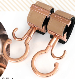
金具：ピンクゴールド